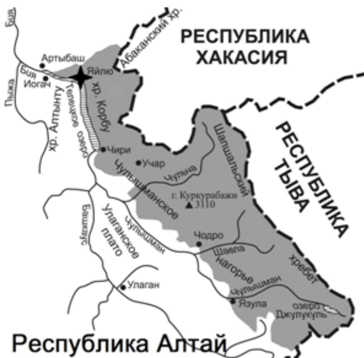
Рис. 1. Карта-схема района исследований с выделением территории Алтайского государственного природного биосферного заповедника

Алтайский государственный природный биосферный заповедник общей площадью 871206,6 га (в том числе площадь Телецкого озера — 11410 га), расположенный в азиатской части России, был основан 16 апреля 1932 г. (рис. 1). Это уникальнейшая особоохраняемая природно-биосферная территория, объект Всемирного культурного и природного наследия ЮНЕСКО, входящий в список «Global-200» (WWF) — девственных или мало измененных экорегионов мира, в которых сосредоточено 90% биоразнообразия планеты, при этом занимающий одно из первых мест среди российских заповедников по биологическому разнообразию [11].