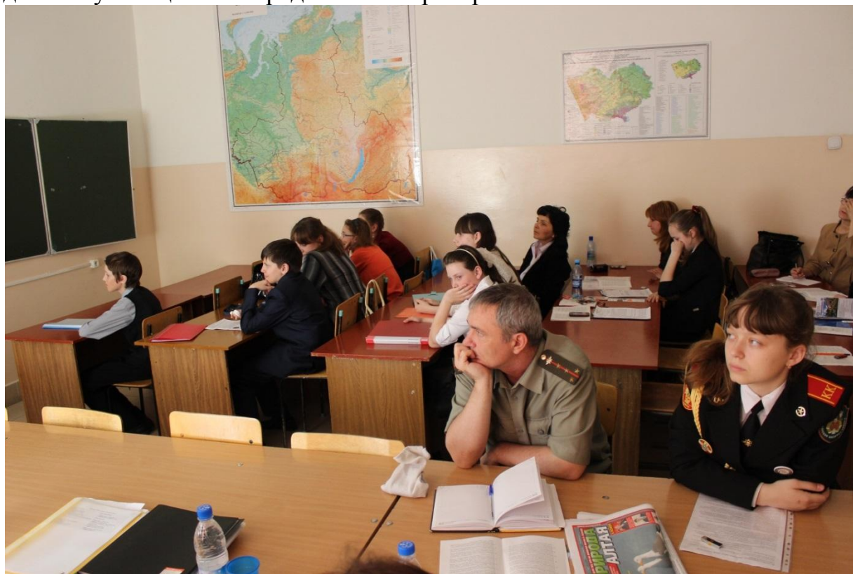
Работа секции «Юные географы» (7 класс)