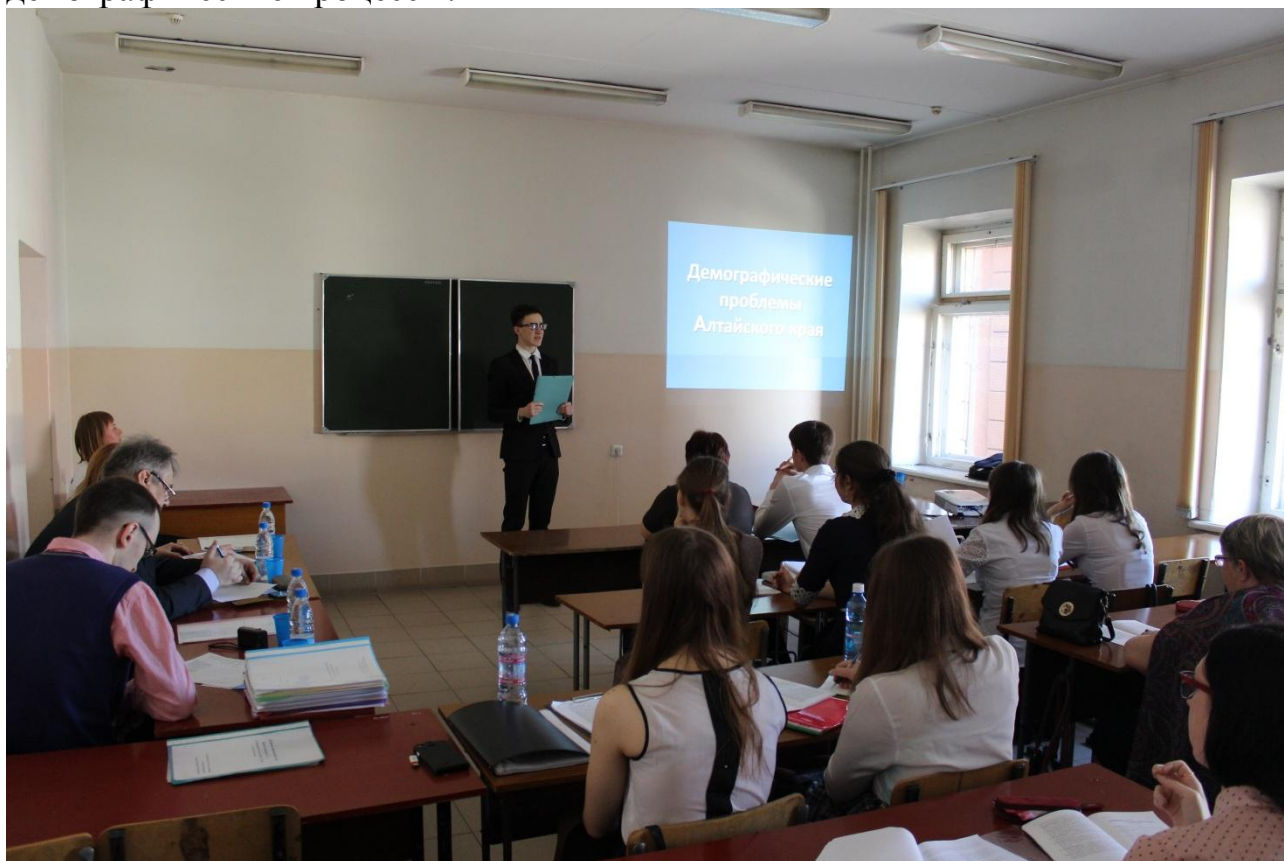
Работа секции «Экономическая и социальная география»

На секции были заслушаны 17 докладов, представляющих широкий спектр общественно-географических исследований. Самым популярным направлением стало демографическое: в том или ином виде этой теме были посвящены шесть выступлений, а масштабы исследования варьировались от общенационального уровня до уровня поселений и даже конкретной школы. В двух работах была представлена тема влияния материнского капитала на демографические процессы.