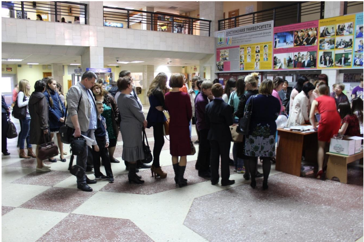
Регистрация участников конкурса «Вокруг света»

В 2015 году конкурс «Вокруг света» поддержан грантом ректора «Лучший проект по профессиональной ориентации учащейся молодежи ФГБОУ ВПО «Алтайский государственный университет» и Алтайским отделением Всероссийской общественной организации «Русское географическое общество».