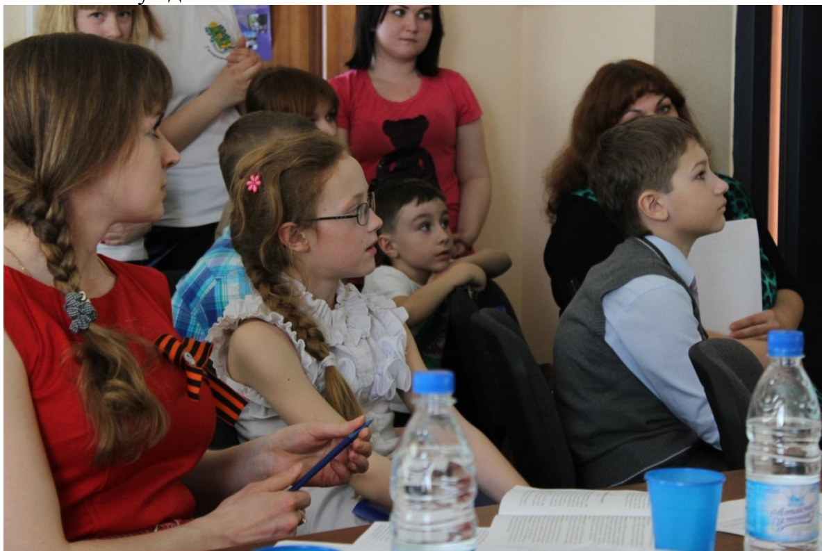
Работа секции «Юные географы» (до 4 класса)

Секция для самых маленьких географов – учеников начальных классов была самой запоминающейся. Всего в работе секции приняли участие 17 ребят. Дети очень убедительно доказывали актуальность своих исследований, делились впечатлениями о проделанных экспериментах. Некоторые ребята даже принесли доказательства своего первого научного труда: квалифицированно собранный и оформленный гербарий, образцы воды, доказывающие ее загрязненность. Работа в секции шла очень оживленно, порой жюри не успевало задавать вопросы, участники активно и с интересом участвовали в обсуждении.