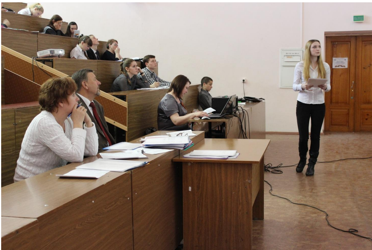
Работа секции «Экология и природопользование»

Исследовательские работы участников секции «Экология и природопользование» имели, несомненно, большую практическую значимость, так как были посвящены вопросам охраны окружающей среды и рациональному природопользованию. Приоритетным направлением докладов стала проблема отходов. Учащиеся описывали трудности, которые сложились в их населенных пунктах по размещению отходов, а также предлагали варианты решения данной проблемы.