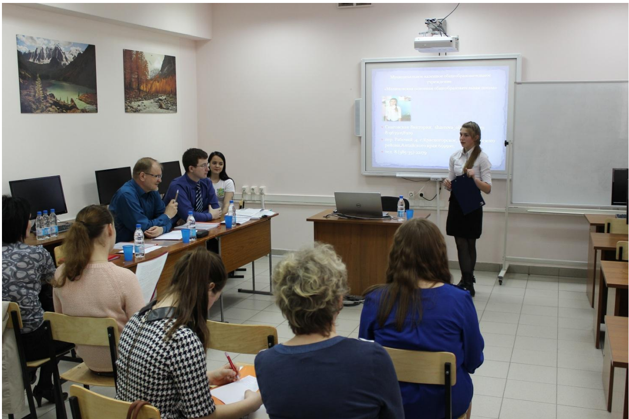
Работа секции «Физическая и рекреационная география»

По итогам работы секции были выявлены победители.