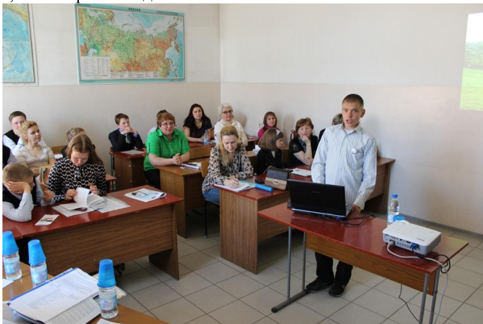
Работа секции «Юные географы» (6 класс)

В секции «Юные географы» (6 класс) с итогами исследований выступили 11 школьников. В ходе работы секции учащимися были представлены разнообразные доклады по актуальным географическим темам. Среди них – описания путешествий по Алтайскому краю, исследования проблем своего села, результаты полевых исследований, символика на флагах стран и др. У всех ребят были подготовлены презентации, составленные с большой тщательностью, а их содержание соответствовало всем предъявляемым требованиям. Слушатели задавали много вопросов докладчикам, на которые они достойно отвечали.